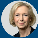
Prof. Dr. Johanna Wanka Bundesministerin für Bildung und Forschung

„Beim Software Campus werden zukünftige Führungskräfte der IT-Branche ausgebildet. Studierende tragen Verantwortung für kleine Forschungsprojekte, lernen in Unternehmen die Praxis kennen und gewinnen Erfahrungen für Spitzenpositionen in Wirtschaft und Forschung. Unternehmen und Bundesregierung investieren in die Zukunft unseres Landes, um Spitzenkräfte im Inland zu fördern und die besten Talente aus dem Ausland für Deutschland zu begeistern.“